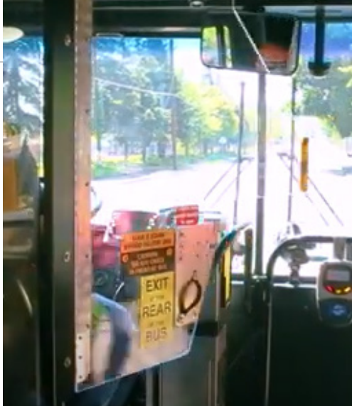
ይህንን የመሰሉ አውቶማቲክ የሆኑ የደህንነት መከላከያዎች የትኩሻ ጎዳት ሊከላከሉ ይችላሉ። ይህንን አይነቱ የደህንነት መከላከያዎች እንዴት እንደሚሰሩ ለማየት፣ ይህንን ቪዲዮ ይመልከቱ። www.youtube.com/watch?v=_052f_g60ag ። የከንግ ካውነቲ ሜትሮ የሮቶ እና ቪዲዮ መልካም አርዳታ።