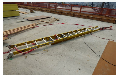
Figura 3: La escalera extensible desde donde cayó el supervisor. Solo un riel extensor estaba sujeto al momento del incidente.