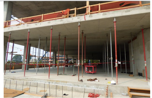
Figura 1: Área donde los trabajadores ubicaron la escalera extensible.

Luego, voltee la página para conocer los factores que contribuyeron y las recomendaciones y los requisitos de seguridad.