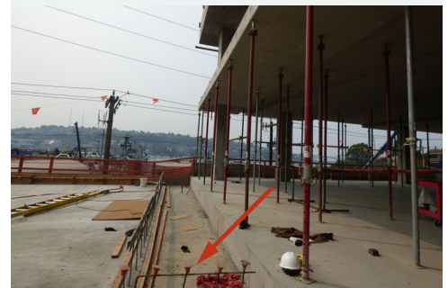
Figura 2: La flecha roja apunta al lugar donde el supervisor cayó de pie cerca de una fila de varillas corrugadas verticales que