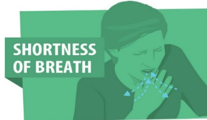
Neefsiga oo Adag