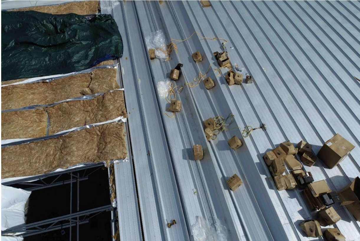
Fotografía 3. Acercamiento del borde de avance que se estaba construyendo y desde el que cayó el instalador de techos. Las cuerdas salvavidas están situadas en donde los instaladores de techos estaban trabajando a 20 pies de distancia del punto de acceso al techo.