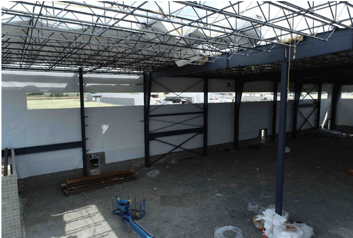
Fotografía 4. Interior del almacén en donde el instalador de techos cayó sobre la grava mientras hacía trabajo de avance sobre el borde en el techo.