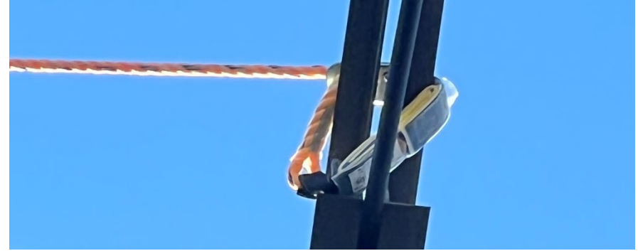
Fotografía 6. Cuerda salvavidas vertical enrollada alrededor de una viga y unida a sí misma.