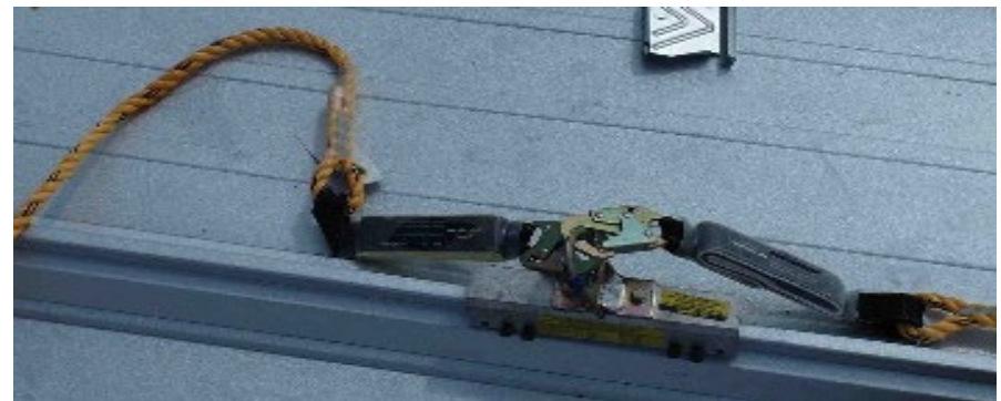
Fotografía 8. Dos cuerdas salvavidas verticales unidas a una ancla de techo.