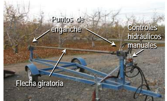
Este diseño no tiene resguardos de seguridad.