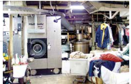
적절한 안전 교육 및 예방 절차가 뒷받침되지 않을 경우 1-BP은 드라이클리닝기계 담당 직원, 프레싱기계 담당 직원뿐만 아니라 카운터 담당 직원의 건강까지 위협할 수 있습니다.