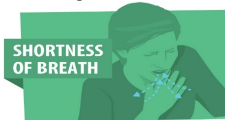
Dificultad para respirar